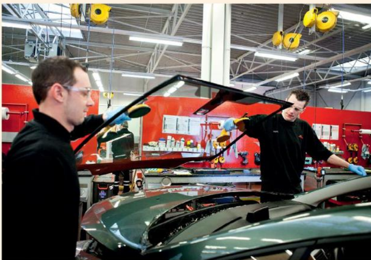
De belangrijkste activiteit van de holding D'Ieteren is Carglass.